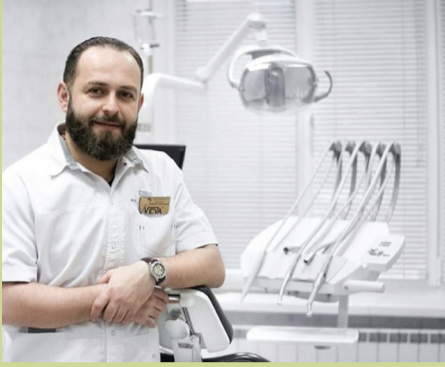
მესტიის საავადმყოფოს ამბულატორიულ გაერთიანებაში