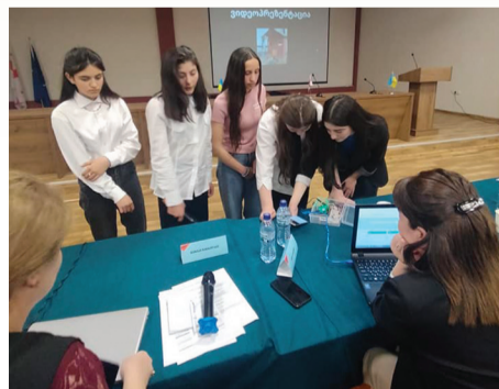
გოგონათა გუნდი ფარისა და

წელს, პირველად, აღნიშნულ პროექტში მესტიის მუნიციპალიტეტის ფარის საჯარო სკოლაც ჩაერთო.